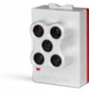
MicaSense RedEdge-MX Líder de la industria